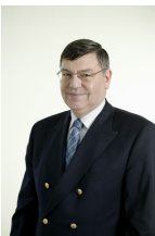
Jean-François Bernicot Membre de la Cour des comptes européenne